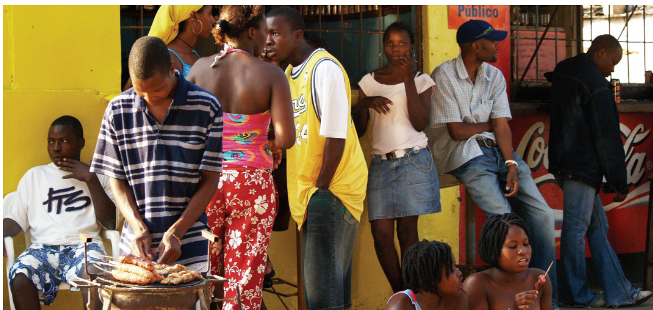
Ungt fólk í Mapútó, Mósambík.

dánartíðnin var hæst hjá börnum yngri en fimm ára og fólki yfir sextugt. Þessi háa dánartíðni ungs fólks hefur snúið við þeirri jákvæðu þróun hækkandi lífslíkna sem náðst hafði með lækkun á dánartíðni ungbarna. Í Botsvana voru lífslíkur komnar upp í 65 ár á tímabilinu 1985-1990 en þær hafa nú hrapað niður í 37 ár. Því er spáð að íbúum fari brátt að fækka ef ekki verður aukning í aðflutningi til landsins. Ekki er gert ráð fyrir almennri fólksfækkun í sunnanverðri Afríku á næsta áratugi þrátt fyrir háa dánartíðni af völdum alnæmis. Hins vegar er talið að fjölgunin verði aðeins um 600 þúsund í stað 17 milljóna sem búast hefði mátt við án alnæmis.