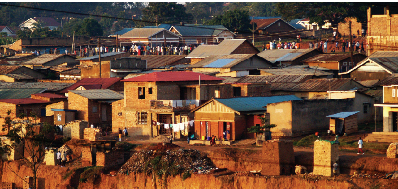
Íbúahverfi í Kampala, Úganda.

Almennt eru ríkin við Gíneuflóann í Vestur-Afríku með hærra hlutfall íbúa í þéttbýli en önnur svæði í Afríku sunnan Sahara. Það er breytilegt hvernig einstaka ríki skilgreina þéttbýli. Á Íslandi flokkast byggð þar sem búa 200 eða fleiri sem þéttbýli, en í Afríku er algengast að miða við 2000-5000 íbúa og að meirihluti þeirra starfi við annað en landbúnað.