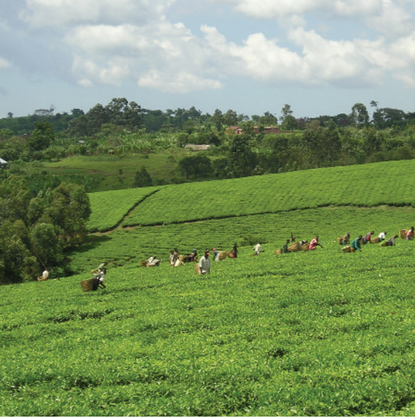
Terækt í Keníu.

skiptastofnuninni, kemur stór hluti útflutningstekna landanna af bómullarsölu eða 51% í Búrkína Fasó, 37% í Tchad og 25% í Malí (árið 2001). Þessi lönd fluttu einnig út mest magn ásamt Fílabeinsströndinni og Kamerún, en vægi bómullar í útflutningstekjum var þó mun minna í síðastnefndu löndunum (3-5%).