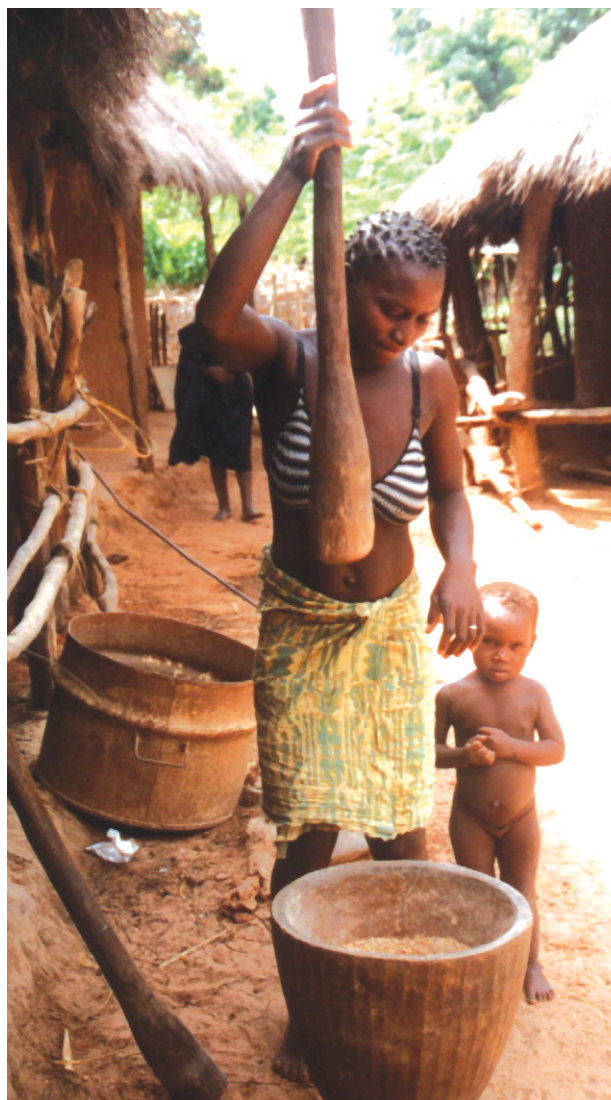
Hrísgtrjón steytt í Biombo, Gíneu-Bissá.

Rök gegn áherslunni á framleiðslu til útflutnings tengjast m.a. umræðu um fæðuframboð og vannæringu. Það þykir brýnna verkefni að nýta náttúruauðlindir, faglegan og fjárhagslegan stuðning til að auka fæðuframleiðslu og uppfylla þannig grunnþörf íbúanna fyrir mat, en að afla gjaldeyris sem óvíst er hvort komi hinum fátækari íbúum til góða. Önnur rök snúa að velferðarmálum og kynjasjónarmiðum. Margar rannsóknir sýna að nýjungar í landbúnaði hafa frekar verið kynntar fyrir körlum vegna valdastöðu þeirra í flestum samfélögum sem birtist m.a. í yferráðum þeirra yfir ræktarlandi. Stuðningur við ræktun á útflutningsafurðum er títtnefnt dæmi um yfirfærslu þekkingar, tækni og fjármagns til karla í landbúnaði á sama tíma og lítið hefur verið stutt við konurnar sem borið hafa mesta ábyrgð á ræktun matvæla fyrir heimilið. Einkum hefur verið bent á þrennt í þessu samhengi. Því er haldið fram að auknar tekjur undir stjórn húsbóndans á heimilinu leiði ekki sjálfkrafa til betri næringar barna og að krafa um vinnuframlag konunnar við ræktun söluafurða gefi henni minni tíma til að sinna ræktun á mat fyrir heimilið og eldamennsku. Í þriðja lagi fer land undir söluafurðir sem áður var nýtt til matvælaframleiðslu. Í umfjöllun