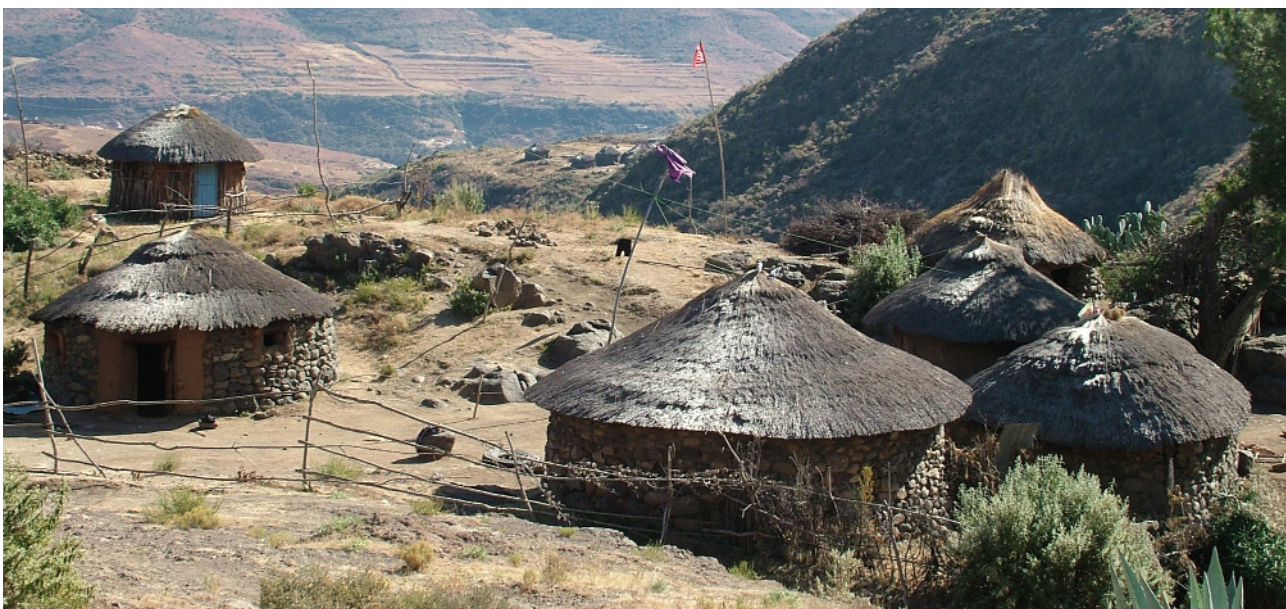
Fjallaborg í Lesótó.

Þrátt fyrir öra borgvæðingu í Afríku sunnan Sahara hafa um 70% íbúa þar meginlífsviðurværi sitt af landbúnaði. Á sama tíma er áætlað að um þriðjungur íbúanna sé vannærður sem vekur upp spurningar um hvers vegna svo margir fái ekki nægilega mikinn og fjölbreyttan mat þegar meirihluti íbúanna vinnur við ræktun af ýmsu tagi. Einhverjir telja sig sjálfsagt hafa einfalt svar við þessari spurningu, þó að í raun sé um samspil margra þátta að ræða. Oft má rekja einföldu svörin til afmarkaðs sjónarhorns fræðigreina og hugmyndafræði eða hrein-