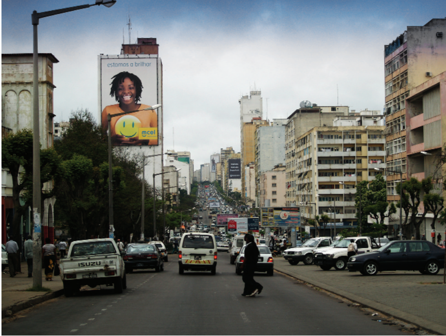
Miðbær Mapútó, Mósambík.

munur skýrist að stórum hluta af náttúrufarslegum aðstæðum en einnig af samfélagslegum þáttum sem fjallað verður um síðar.