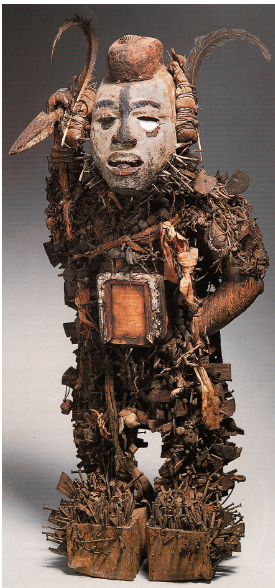
Nkisi-nkondi skurðgoð frá því fyrir 1878. Þau eru notuð til að finna misyndisfólk. Viðarílát, fyllt með jurta-lyfjum, er sett á höfuð og maga styttunnar eða milli fóta hennar. Andi styttunnar er hvattur áfram með ögrandi tiltali eða með því að reka í hana oddhvassa hluti.

gerð afrískra lista með nokkuð yfirborðslegum hætti án þess að leitast við að skilja fagurfræði og menningarlegan bakgrunn þeirra er þetta tímabil mikilvægt fyrir þær sakir að í fyrsta skipti fékk almenningur á Vesturlöndum áhuga á afrískri list.