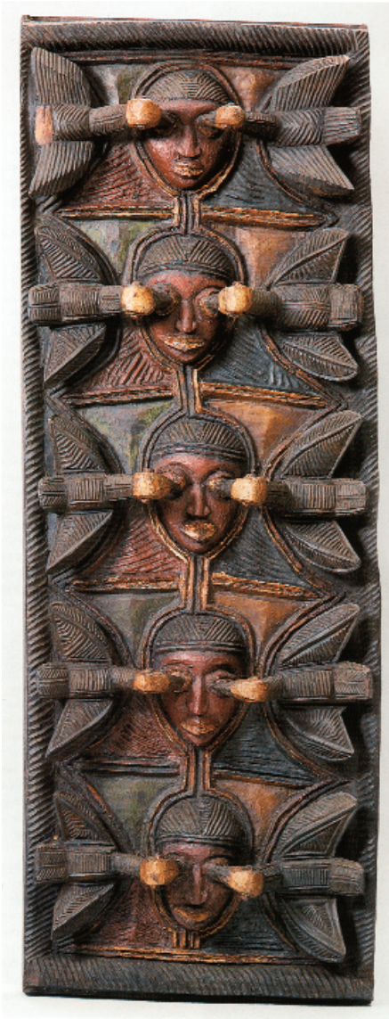
Burðartré fyrir hurð eða glugga skorid út af Olowe frá Ise-Ekiti í Nígeríu.

mismunandi viðarbúttum sé skeytt saman í eitt verk, og einmitt þess vegna er hið aflanga og upprétta form svo algengt.