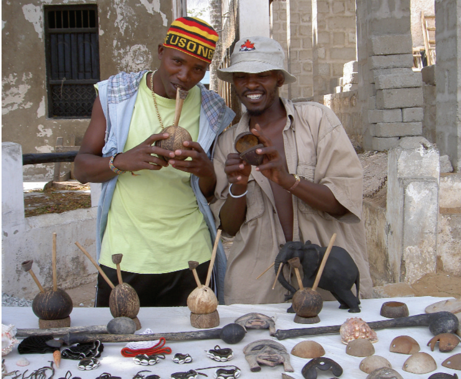
Sölumenn á eyinni Lamu í Keníu bjóða ferðamönnum varning sinn.

sem þau eru samsett úr afgöngum stærri viðarbúta, sem ganga af við útskurð hefðbundinna höggmynda, sem og minni trjágreinum. Bútarnir eru síðan límdir saman með lími sem er sjaldgæf aðferð í afrísku handverki og kom ekki fram á sjónarsviðið fyrir en á nýlendutímanum. Verkin eru skoplegar raunsæismyndir úr hversdagslífinu og sýna ýmiss konar iðju fólks, eins og rakara, skurðlækna, flugmenn, saumakonur eða nútímakonur við skrifstofuvinnu, og þau eiga sinn þátt í að gleðja bæði augu gestgjafa sem og gesta (sjá kápu-mynd). Víða annars staðar í álfunni, eins og í Mósambík eða á Fílabeinsströndinni, má finna fleiri slík verk er miða að því að sýna hversdagslegan veruleika og eru viðbót við þá ótæmandi listaflóru er prýðir álfuna alla.