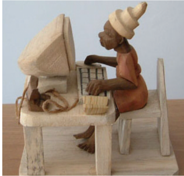
Þyrniverk keypt á markaðinum Lekki í Lagos, Nígíeríu. Verkið endurspeglar hversdagslegan veruleika margra afrískra kvenna.

Afríkubúar taka stoltir á móti gestum með því að bjóða til sölu handverk sem ýmist byggir á fornum hefðum eða nota tækifærið til nýstárlegra tilrauna sem bera hinni óþrjótandi sköpunargleði vitni. Sem dæmi um nýjar listgerðir má nefna svokölluð þyrniverk eða thorn carvings sem urðu til í Nígíeríu á sjöunda áratugnum. Þeim var í fyrstu beint að nýlenduherrum sem og öðru vestrænu aðkomufólki á svæðinu en eru í dag að vinsælli söluvöru á listaverkaupboðum víða um heim sem og á ferðamannamörkuðum. Þessi verk eru ólík öðrum tréskurði þar