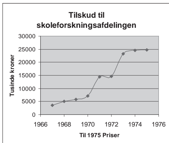
Figur 2. Tilskud til Skoleforskningsafdelingen.

Figur 1 og 2 illustrerer tilskud fra Altinget til udviklingsprojekterne i Skoleforskningsafdelingen og til Statsforlaget for lærebøger i perioden 1967-1975, omregnet til 1975-priser ( Stjórnartíðindi , 1966-1975. Budget). En mindre krise i 1968, forandring af parlamentarisk majoritet i 1971, oliekrisen i 1973 og et samtidigt vulkanudbrud på Vestmannaøernes eneste beboede ø, Heimaey, ændrede ikke på de stadig voksende tilskud til reformen af uddannelsessystemet.