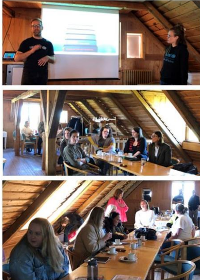
Mynd 3. Upphafsfundur verkefnisins

Sex mánaðarlegir tveggja tíma fundir voru skipulagðir með tengiliðum leikskólanna þar sem fram fór fræðsla og umræða um skilgreinda verkþætti. Einnig var haldinn sameiginlegur starfsmannafundur allra leikskólanna í mars 2023. Á milli funda unnu þátttakendur verkefni með samstarfsfólki sem öll miðuðu að því að innleiða réttindi barna í daglegt starf hvers leikskóla.