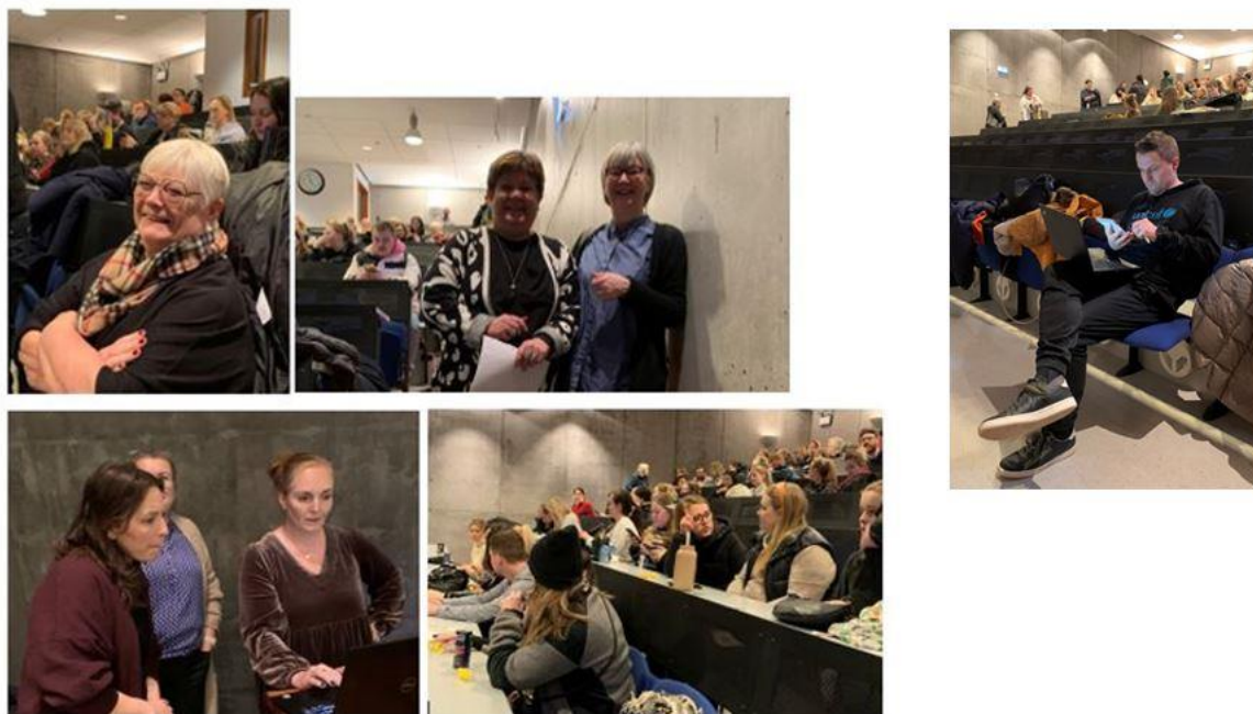
Mynd 5. Kynning frá Kópavogsbæ á fundi með öllu starfsfólki leikskólanna

15. maí 2023 - Kerhólar, 7. hæð Borgartúni 12.