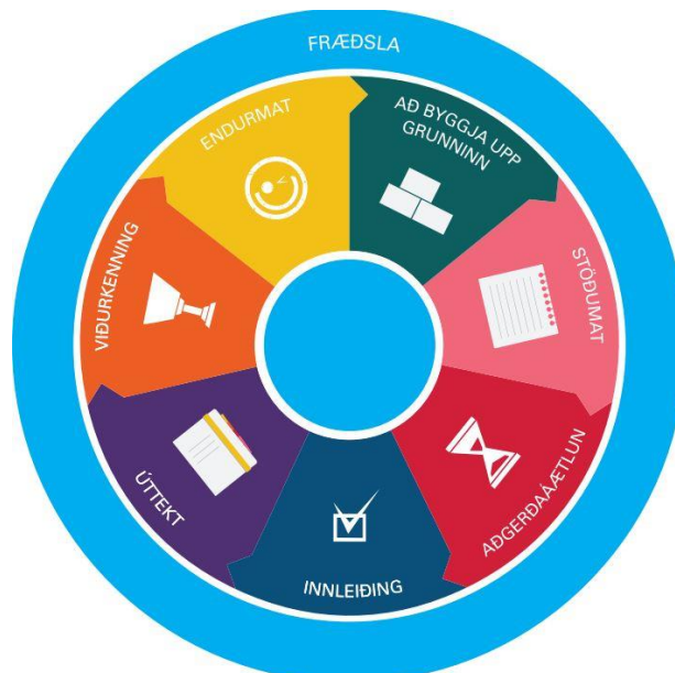
Mynd 1. Innleiðingahringur réttindaskóla