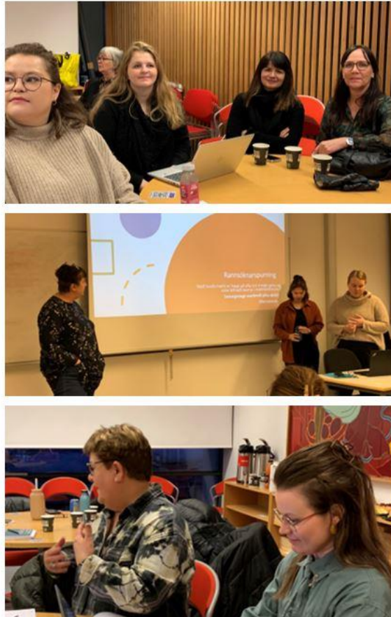
Mynd 4. Fundur á menntavísindasviði

21. mars 2023 - Menntavísindasvið Háskóla Íslands, Stakkahlíð