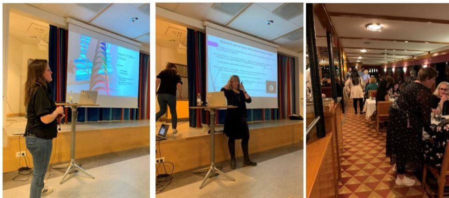
Mynd 6. Heimsókn í leikskóla í Stokkhólmi og fyrirlestrar haldnir

Stokkhólmsferðin var liður í að ljúka fyrsta vetri verkefnisins og skoða sérstaklega starf leikskóla sem vinna með virkt hlutverk starfsfólks í leik barna, námsumhverfið og barnahópin. Tveir leikskólar voru heimsóttir og hlustað á fyrirlestra um félagslega sjálfbærni í leik og virkt hlutverk starfsfólks í leik barna (sjá mynd 6). Tekin voru fyrstu skrefin í að undirbúa frekari samvinnu leikskólanna veturinn 2023-2024 með reglulegum heimsóknum starfsfólks sem styrktar verða af Erasmusplús og sameiginlegri þemavinnu leikskólanna um leik barna