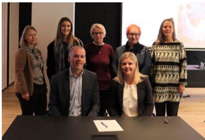
Frá undirskrift Garðabæjar og RannUng 27. september 2022

Sáttmáli Sameinuðu þjóðanna um réttindi barna, oftast nefndur Barnasáttmálinn , var samþykktur árið 1989 af öllum þjóðum Sameinuðu þjóðanna að undanskildum Bandaríkjunum. Sáttmálinn samanstendur af 54 greinum um réttindi barna. Barnasáttmálinn var fullgiltur fyrir Íslands hönd árið 1992 en fullgilding hans felur í sér að Ísland er skuldbundið að þjóðarétti til að virða og uppfylla ákvæði sáttmálans. Barnasáttmálinn var lögfestur hér á landi 20. febrúar 2013 og er nú hluti af íslenskri löggjöf (lög um samning Sameinuðu þjóðanna um réttindi barnsins nr. 19/2013). Barnasáttmálinn felur í sér viðurkenningu á því að börn séu sjálfstæðir einstaklingar með fullgild réttindi, óháð réttindum fullorðinna.