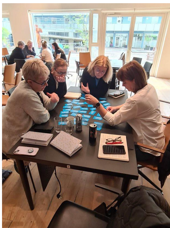
Þátttakendur velja 10 greinar Barnasáttmálans

Hér er upptalning á þeim greinum sem þátttakendur vilja leggja áherslu á en þeim er raðað í númeraröð.