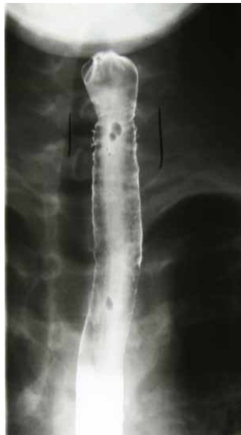
Mynd 1. Röntgenmynd af hluta vélinda, lýst sem fyllingu á recessum í vélindaveggnum sem samræmdest útliti „intramural esophageal pseudo-diverticulosis“.

Þrettán ára stúlka leitaði á bráðamóttöku eftir að matarbiti stóð í henni. Hún lýsti því þannig að hann væri fastur í miðju brjósti. Hún var áður hraust en átti þó til að fá endurtekinn og þrálátan áblástur á varir og átti stundum erfitt með að kyngja. Við skoðun átti hún erfitt með að kyngja munnvatni og lét það leka út um munn. Einnig átti hún erfitt með tal. Skoðun á slímhúð í munni og koki, hlustun brjósthol og kviðskoðun voru eðlileg. Myndgreining sýndi ótila á móts við hálslið 6. Stúlkan var vélindaspegluð og kjötbiti fjarlægður en speglunarskýrsla lýsir hvorki slímhúð né voru sýni tekin. Í framhaldi leit að stúlkan til sérfræðings í meltingarsjúkdómum barna vegna óþæginda í brjósti og kyngingarerfiðleika. Myndgreining var framkvæmd og sýndi óeðlilega slímhúð á svæði C7 (hálsliður nr. 7) til Th1 (brjóstholslíðsbolur nr. 1), lýst sem „þrengingu á 2 cm svæði með fyllingu á recessum í vélindaveggnum sem samræmdest útliti intramural esophageal pseudo-diverticulosis“ (mynd 1). Endurtekin vélinda- og magaspeglun sýndi eðlilega vítt vélinda án nokkurra þrengsla með línulaga hvítum útfellingum eftir endilöngu vélinda og einnig hringjum, og viðkvæmri slímhúð sem blæddi auðveldlega við sýnatöku (mynd 2). Sýni frá vélinda sýndi bólgu með áberandi íferð rauðkyrninga. Ofnæmisprufur, bæði húðprufur og blóðprufur, voru neikvæðar nema væg svörun