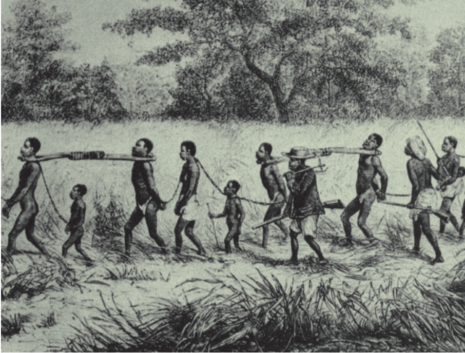
Teikning frá 19. öld af flutningi þræla til hafnar, þaðan sem þeir voru sendir til Ameríku.

sameiginlegs kynþáttar og menningar hafi Afríkumenn ekki selt hvor annan í ánaud. Lögð er áhersla á afríska einingu og hjálparleysi gagnvart þeim sem meira máttu sín hernaðarlega. Þessu hafna margir á þeirri forsendu að hugmyndin um afríska einingu hafi ekki verið til á þessum tíma og á sama hátt litu íbúar Evrópu ekki á sig sem Evrópubúa heldur miðaðist sjálfsmynd þeirra við þjóðernishópa á tilteknum svæðum. Mikilvægt sé að hafa í huga að hugmyndir okkar um kynþátt og sjálfsmynd voru ekki þær sömu og þær eru í dag. Líklegt er að konungur Kongóríkisins hafi gert bandalag við Portúgala til að verjast óvinveittum nágroñnum og í framhaldi af því tekið óvinina til fanga og selt þá sem þræla í gullnámur akanfólksins.