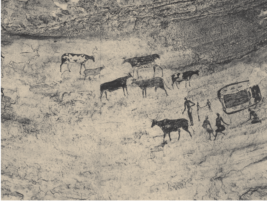
Klettmálverk frá Tassili-n'Ajjer í Alsír. Verkið er talið vera allt að 7000 ára gamalt.

með sín sérkenni. Löngu síðar lifðu nútímamaðurinn og neanderdalsmaðurinn samtímis í Evrópu og Austurlöndum nær. Nútímamaðurinn lifði af en neanderdalsmaðurinn dó út án þess að skilja eftir sig afkomendur.