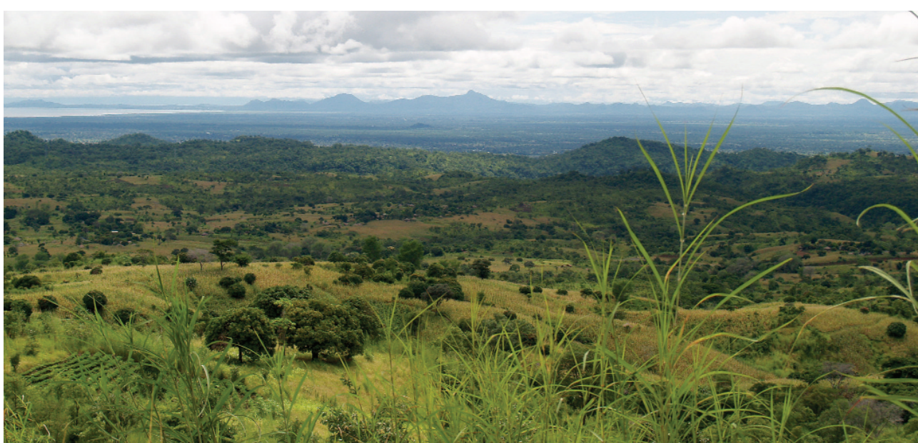
Fjallasýn í Malaví.

Mzilikazi er annar leiðtogi þessa tíma. Hann var sennilega súlúi sem var í samfloti við Shaka en milli þeirra urðu vinslit. Hann flutti því norðvestur að enda hásléttunnar ásamt um tvö hundruð fylgismönnum. Í kjölfar þurkanna miklu, sem hófust árið 1825, byrjaði Mzilikazi að byggja upp ríki sem nefndist Ndebele og hann veitti fólki vernd gegn árásum grikva að vestan og súlúa að austan. Allir, sem völdu að vera undir hans vernd, urðu að taka upp siði súlúa og læra tungumál þeirra, nguni. Mzilikazi kallaði fólk sitt súlúa þó svo að uppruni þess væri mismunandi. Ríki Mzilikazis er því dæmi um fólk af mismunandi uppruna sem sameinaðist undir heitinu súlúar, samtímis sem aðrir súlúar voru verstu óvinir þeirra.