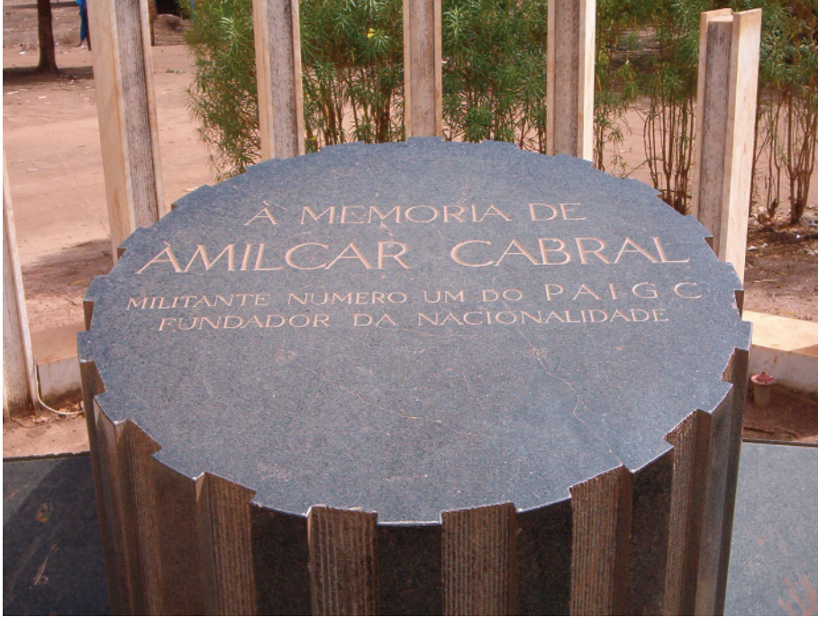
Minnismerki um Amílcar Cabral, þjóðhetju Gíneu-Bissá, í fæðingarborg hans, Bafata.

Árið 1923 ákváðu evrópskir landnemar að skipta Ródesíu í nýlendurnar Suður-Ródesíu (Zimbabve) og Norður-Ródesíu (Zambía). Þessar bresku nýlendur voru síðar sameinaðar undir heitinu Sambandsríki Ródesíu og Nýasalands (Malaví) og hafði það takmarkað sjálfstæði frá 1953 til ársins 1963. Leiðir skildu þegar Zambía og Malaví fengu fullt sjálfstæði árið 1963. Hvítir landnemar Suður-Ródesíu börðust gegn sjálfstæði en árið 1965 lýstu þeir yfir að landið yrði sjálfstætt ríki (Ródesía) sem skyldi lúta stjórn hvíta minnihlutans. Minnihlutastjórnin varð að láta af völdum árið 1980 eftir vopnuð átök sjálfstæðishreyfinga sem börðust fyrir jöfnum réttindum allra íbúanna. Þá var nafni landsins breytt í Zimbabve.