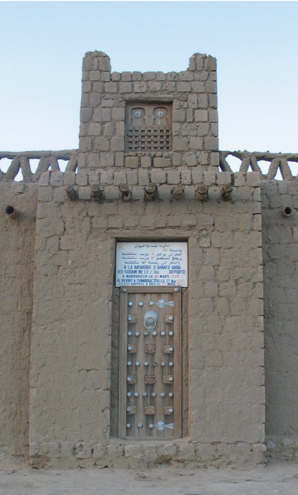
Framhlið á húsi Ahmed Baba í Timbúktú, Malí.