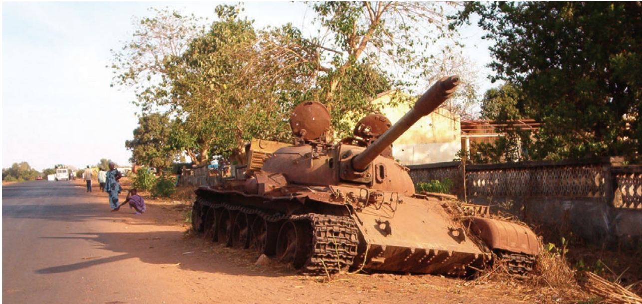
Leifar stríðsátaka 1998-1999 í Bissá, höfuðborg Gíneu-Bissá.

Algengt er að útskýra átök í Afríku með því að vísa til þess að afrísk stríð eigi rætur í aldagömlum deilum sem tengjast að litlu leyti stöðu mála í nútím-