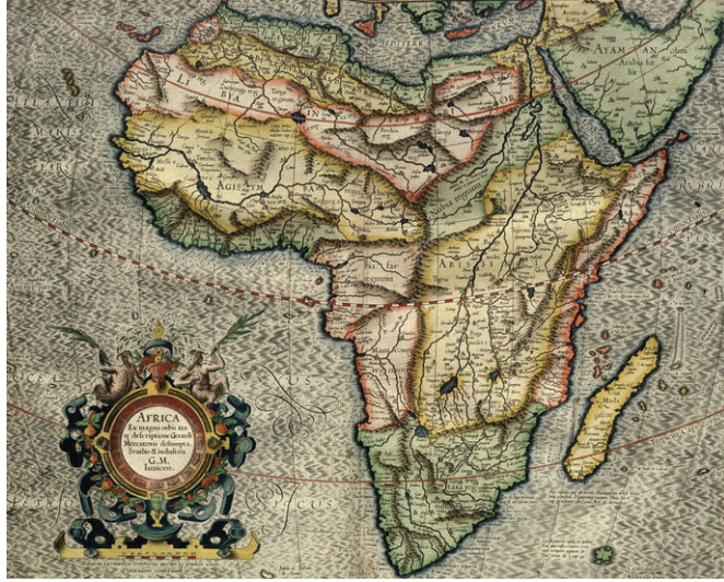
Kort af Afríku frá árinu 1595 teiknað af Gerardus Mercator.

mikilsverð málefni voru útilokuð sem verðug rannsóknar efni, svo sem trúarbrögð, kynjafræði, sjúkdómar, landbúnaður og bændahreyfingar. Það var ekki fyrr en um 1970 að áhugi á rannsóknum á sögu Afríku jókst verulega. Sagnfræðingar, sem vildu kynna sér sögu álfunnar, studdust ýmist við evrópskar heimildir